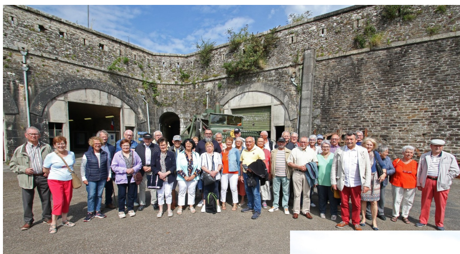
Les adhérents au Fort Montbarrey le 8 juin dernier