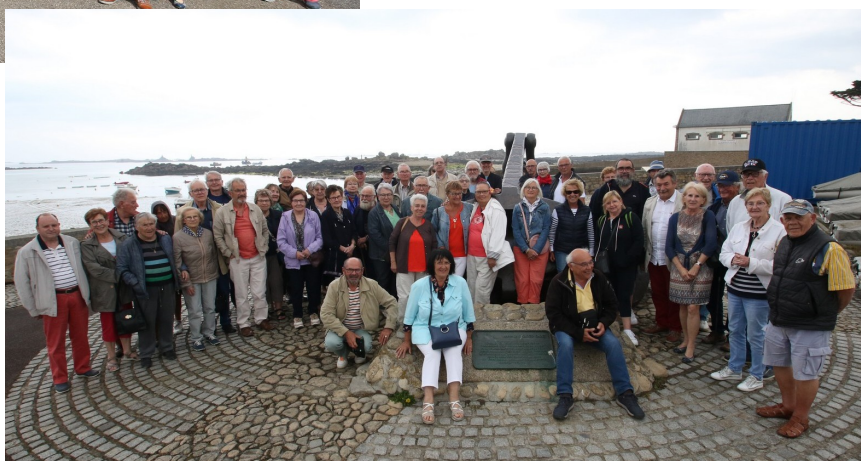
Autour de l'ancre de l' «Amoco Cadiz»