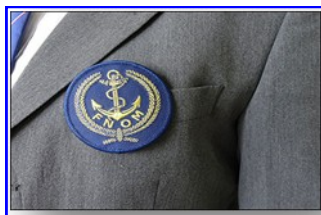
ECUSSON 2,50 €