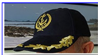
CASQUETTE BRODEE 13 €