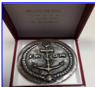
MEDAILLON FNOM 30 €