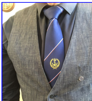
CRAVATE 14 €