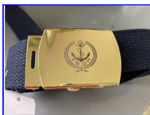
CEINTURE AVEC BOUCLE