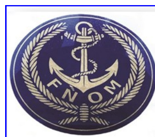
Autocollant vitrophanie 8 cm 0,50 €