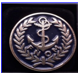
PIN'S 1,50 €