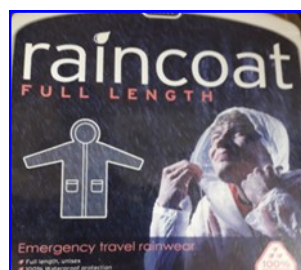
Imperméable 15,00 €

Vous pouvez passer commande au secrétariat de l'AOM29N ou auprès de votre président de section.