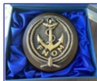
TAPE DE BOUCHE 12,5 cm

Tarifs et commande : secrétariat de l'AOM29N - 02 98 22 10 15