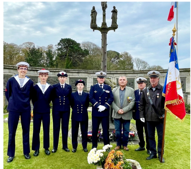
à Saint-Pol-de-Léon avec un détachement de la PMM de Morlaix