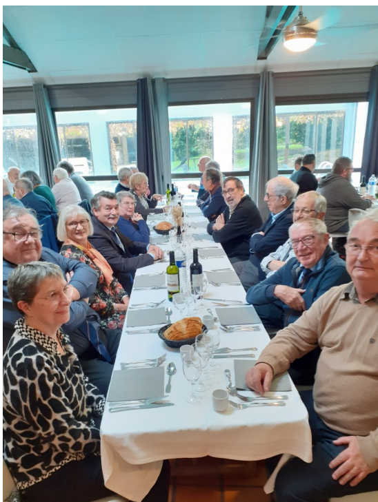
Repas au manoir de Curru