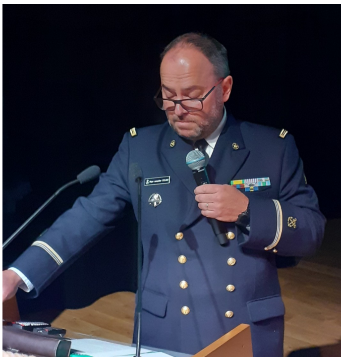
Le major conseiller de l'amiral Ceclant