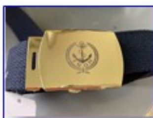
CEINTURE AVEC BOUCLE