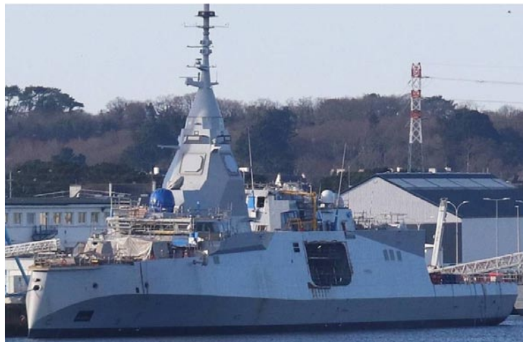
L'Amiral Ronarc'h, première frégate française, doit débiter ses essais en mer très prochainement.