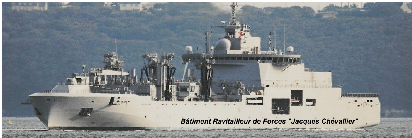
Bâtiment Ravitailleur de Forces "Jacques Chevallier"