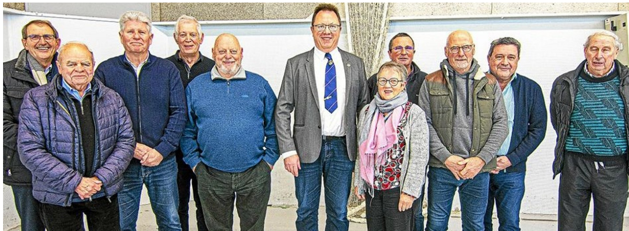
Le membres du bureau 2024